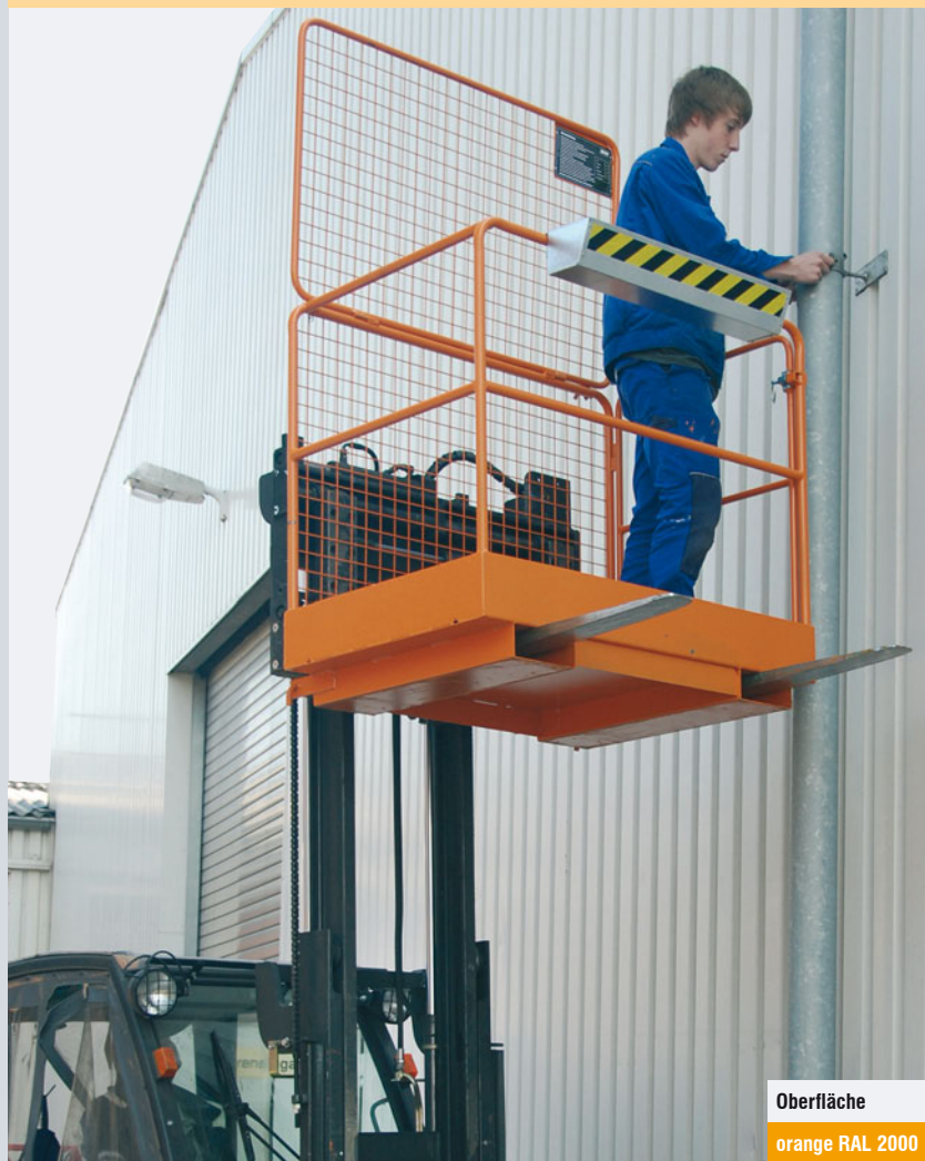
Oberfläche orange RAL 2000